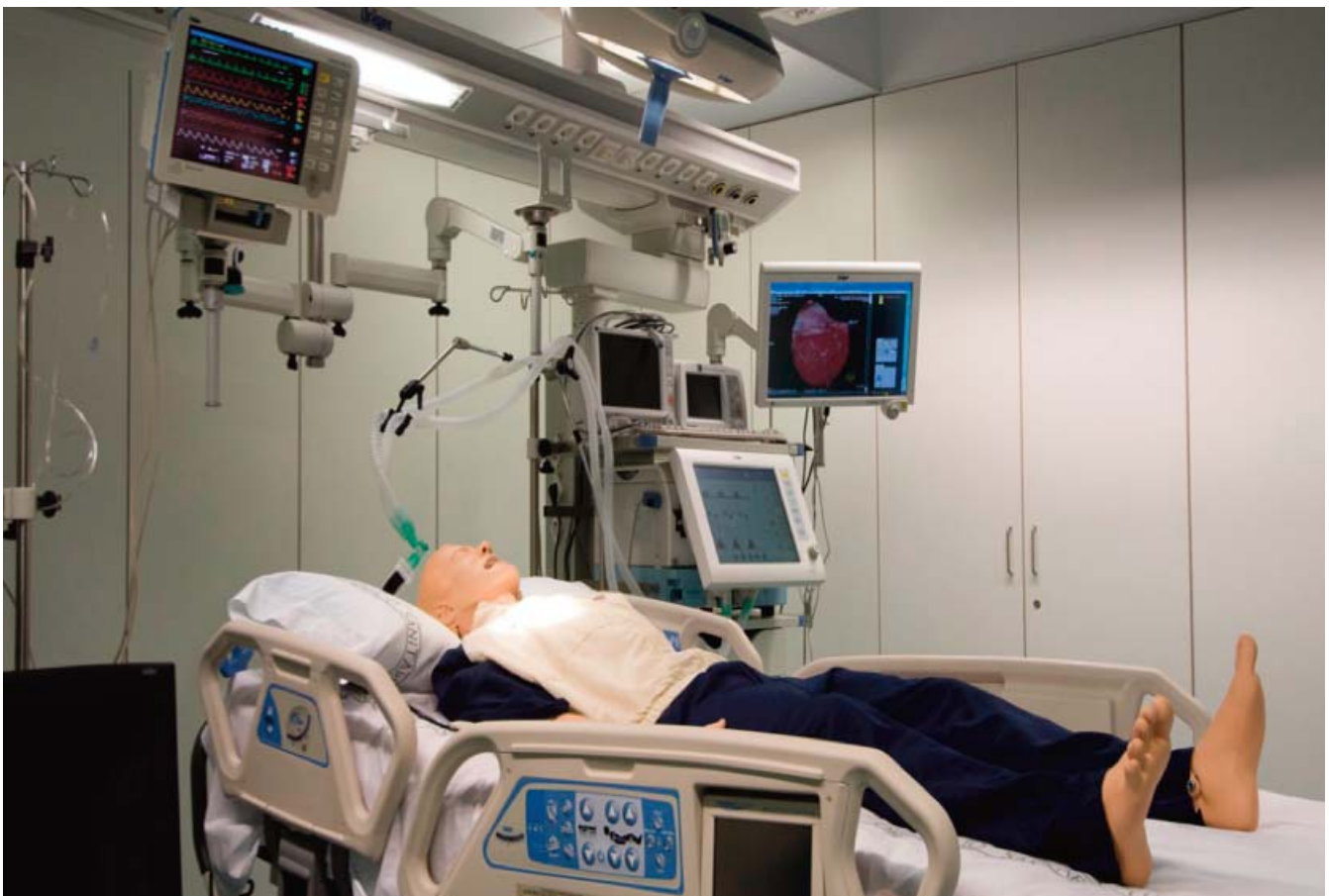
Laboratorio de Simulación Clínica. Universidad de Barcelona

Incluye un proyecto individual final que deberá defenderse públicamente ante el profesorado del equipo docente.